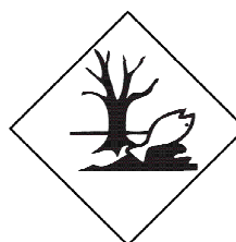
Format 100 x 100mm

Nous contacter au 01 48 82 51 51 ou par email sur info@gmjphoenix.com . Notre site www.gmjphoenix.com